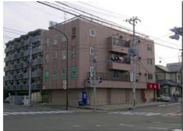
■生活支援ホーム新田の外観

グループホーム・ケアホームを併設して運用しているため、世話人(寮母)が常駐しており、安心して暮らすことができる。利用者(軽度な障害者)の必要に応じた生活援助(相談相手、日常生活指導など)を行う世話人は、コミュニケーション能力の高い、50 歳以上 70 歳未満の女性を募集・採用している。