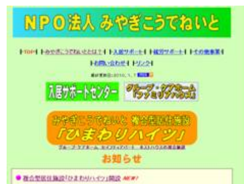
■みやぎこうでねいとホームページのトップ画面 ( http://www.m-koudeneito.or.jp/index.html )

居サポートセンター」を実施した。これにより、従来の入居支援で行ってきたノウハウを、ホームページなどを活用したシステムとして整備した。ホームページには、物件詳細や写真などが掲載されており、理解やイメージがしやすい充実した内容となっている。これにより、ホームページをみながらの相談も増えている。