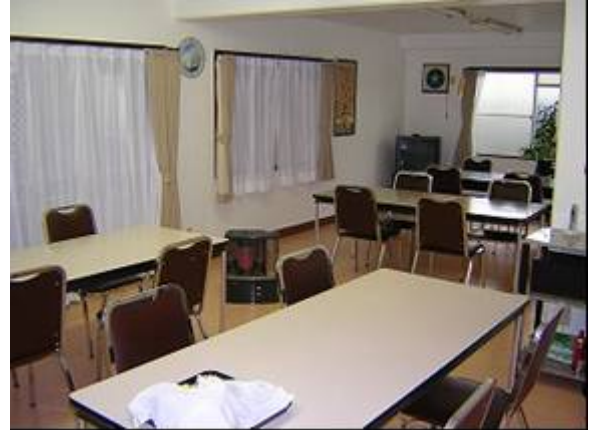
■ひまわりハイツの食堂・談話室