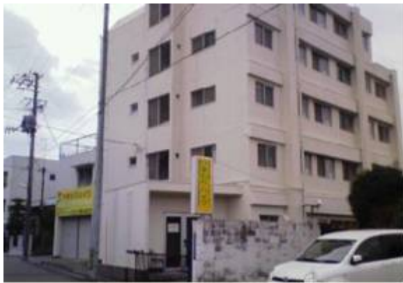
■ひまわりハイツの外観