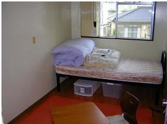
■ひまわりハイツの個室（配置例）